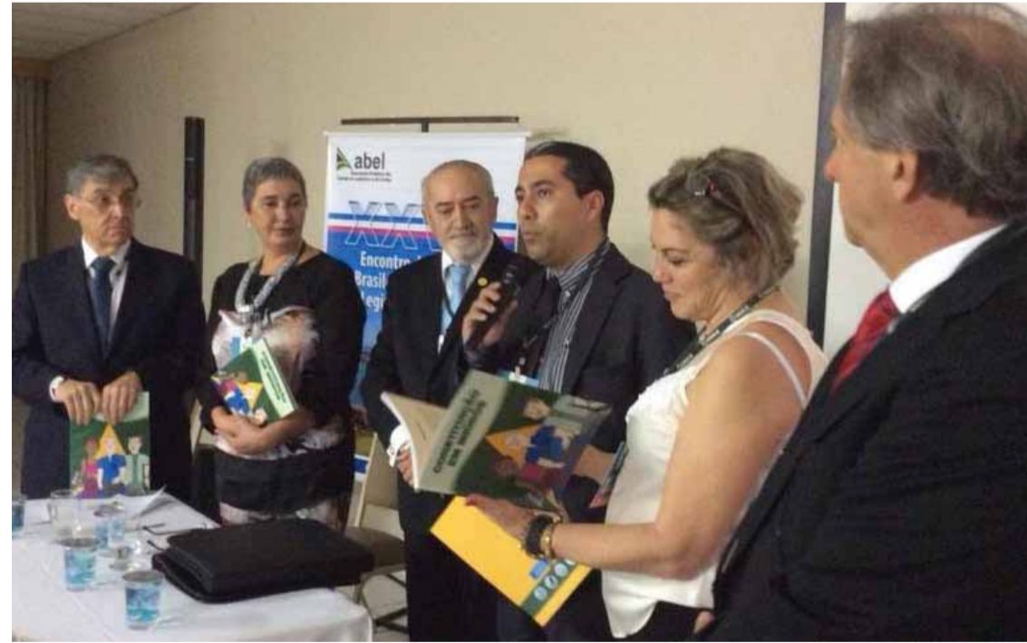
Constituição adaptada em Pouso Alegre vai ganhar as salas de aula do Ensino Fundamental em todo país

"Este é um momento de extrema importância para nossa cidade. A adaptação da Cons-