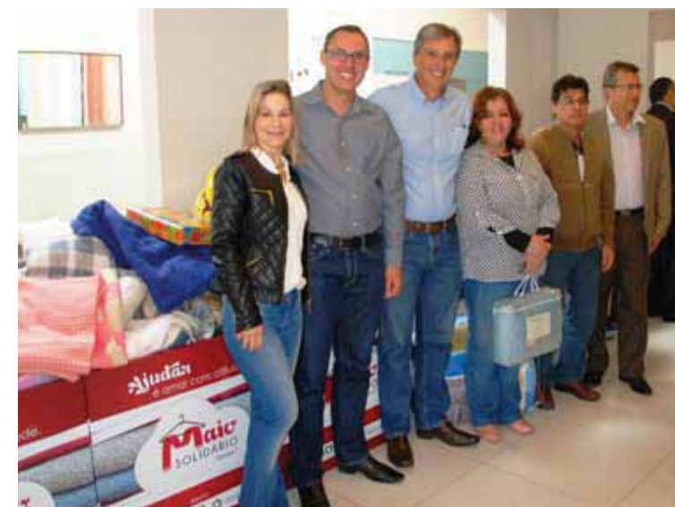
Campanha arrecadou 3.500 peças de roupas em um mês.