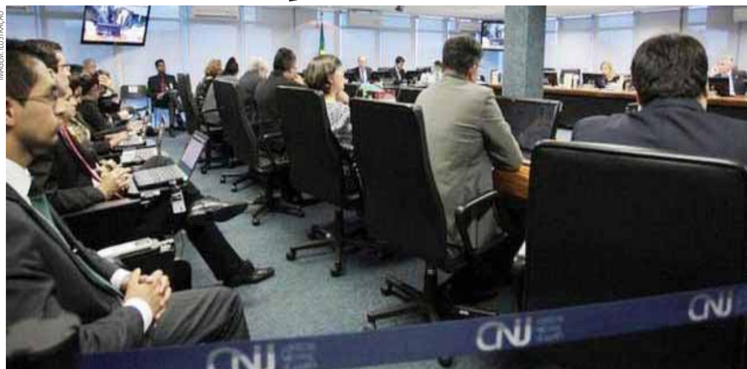
Com a aprovação do CNJ, mais de 600 negros foram nomeados em concursos nos últimos dias