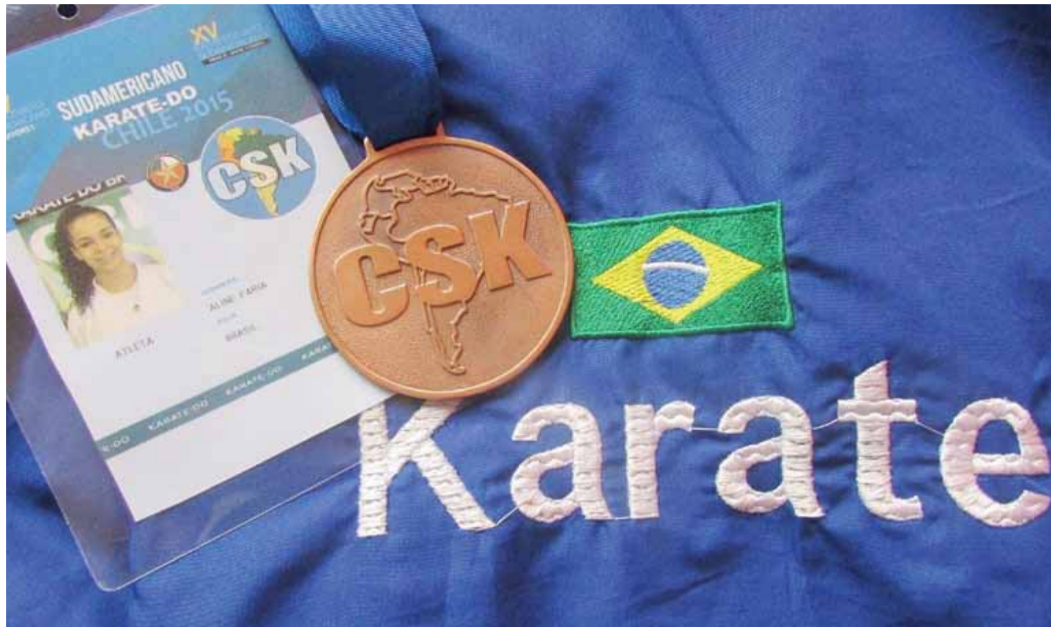
As atletas venceram a Venezuela e o Peru, mas perderam para o Uruguai e ficaram com a terceira posição no pódio.