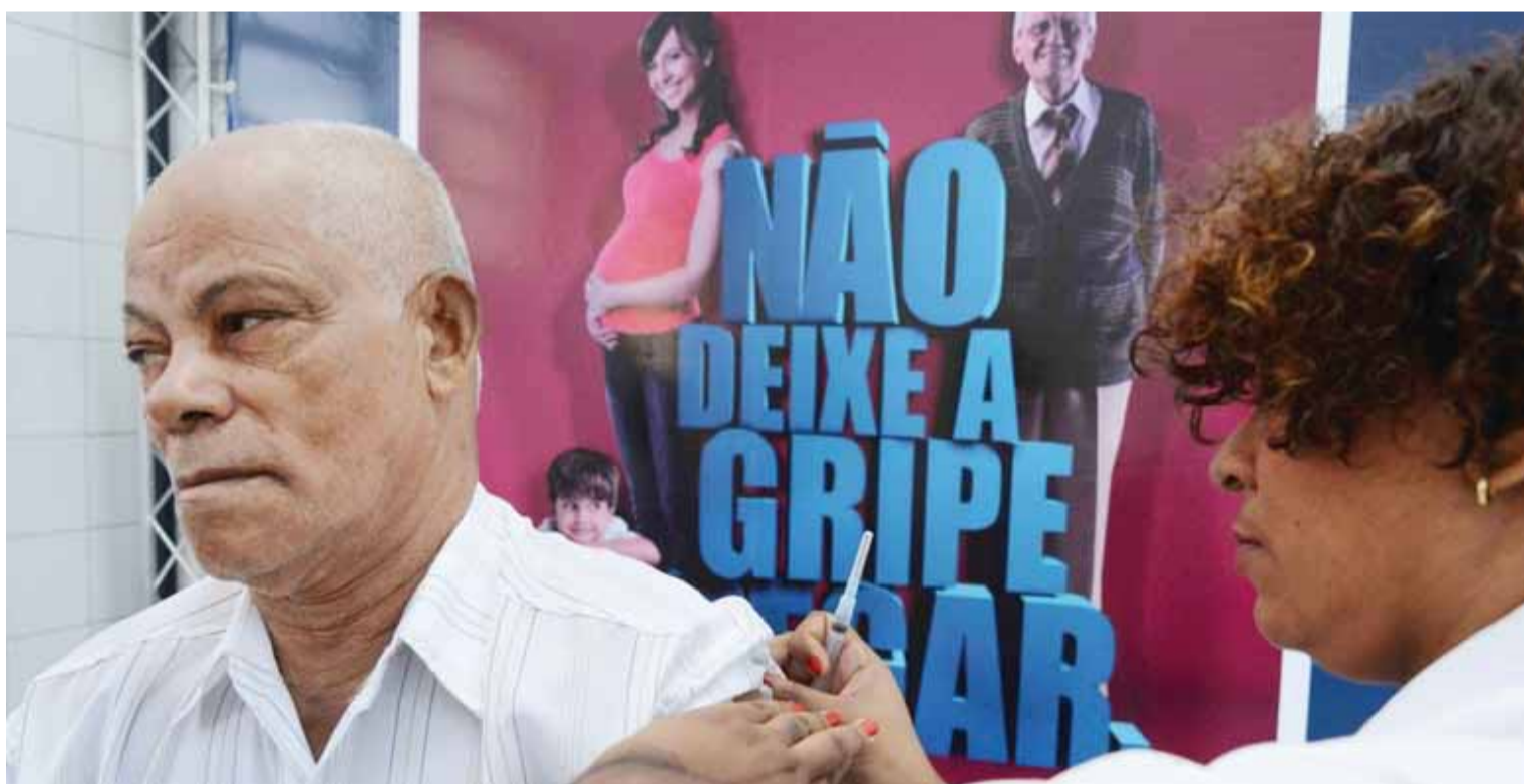
A meta é vacinar 80% e Pouso Alegre já vacinou pouco mais de 70% do público-alvo.