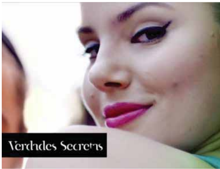
Verdades Secretas, a nova novela das 23h na Globo

Na segunda parte, já em São Paulo, a jovem encontra dificuldades na cidade grande, mas é recompensada com a oportunidade de entrar