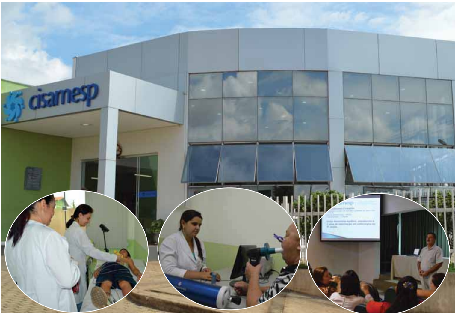
Com gestão competente, Cisamesp vira referência em saúde pública e recebe avaliação positiva de seus pacientes