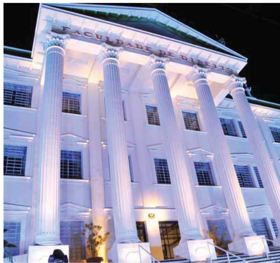
Prédio sede da FDSM.