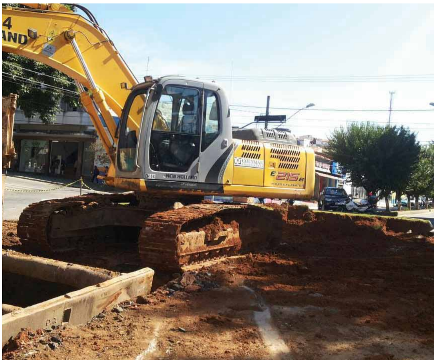
Na Avenida João Beraldo, as obras de ampliação das galerias seguem pela rotatória que cruza com a Duque de Caxias

Partes da Avenida Comendador José Garcia e da Rua Monsenhor Dutra serão as primeiras a terem o trânsito interditado. A extensão do fechamento do trânsito começará na esquina da Avenida Comendador José Garcia com a Rua João Basílio e seguirá entrando a esquerda na Rua Monsenhor Dutra.