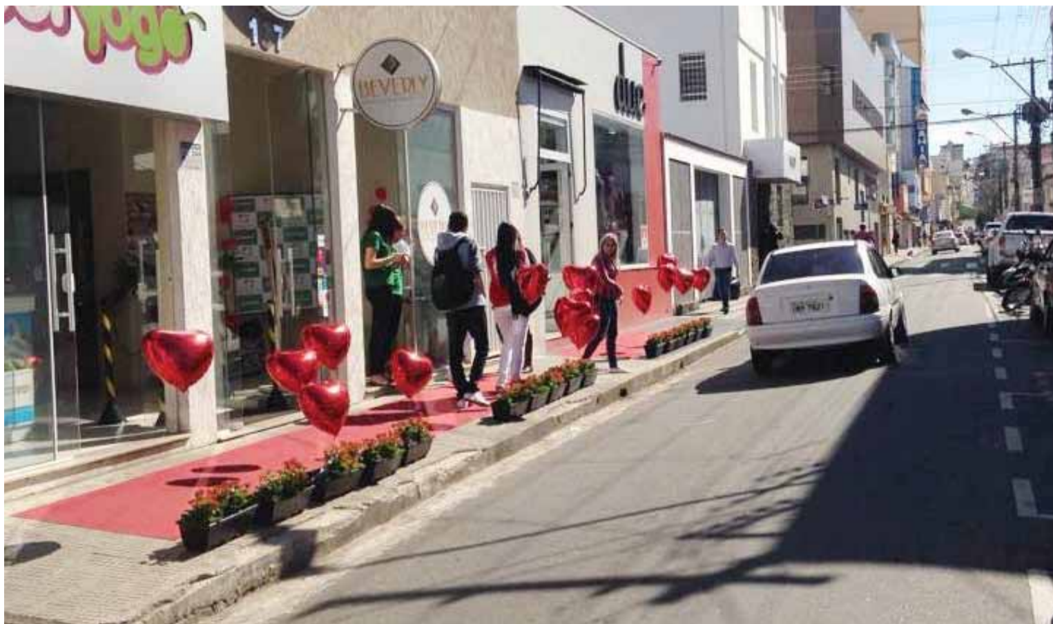
Cerca de 34 donos de lojas de Pouso Alegre se uniram para fazer uma ação independente para conseguir atrair os consumidores.